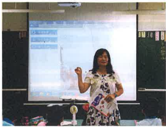
活動說明：健體課海洋食品介紹