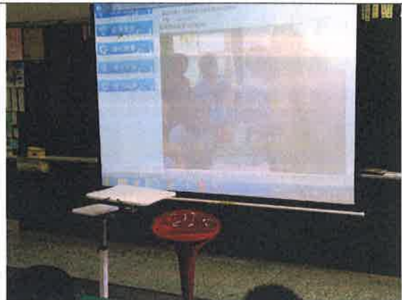
活動說明：海洋教育網站說明