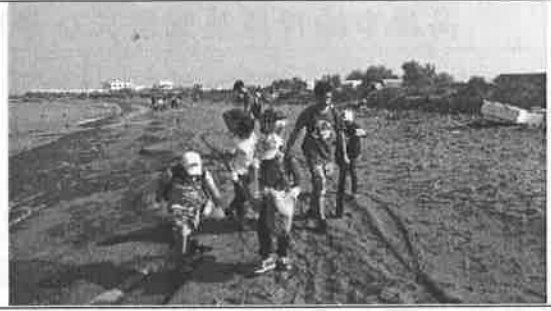
活動說明：看我們多認真的撿拾垃圾