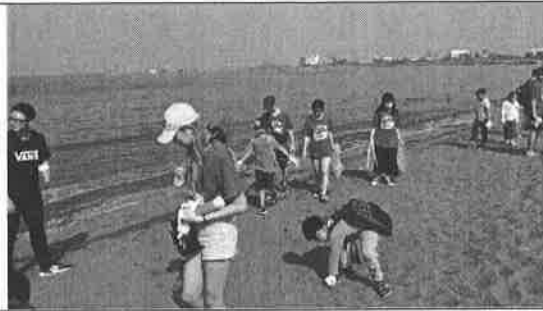
活動說明：看我們多認真的撿拾垃圾