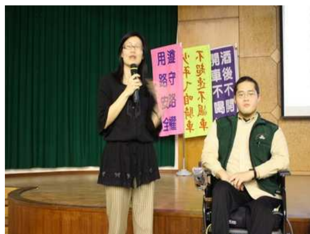
成功之家主任介紹成員