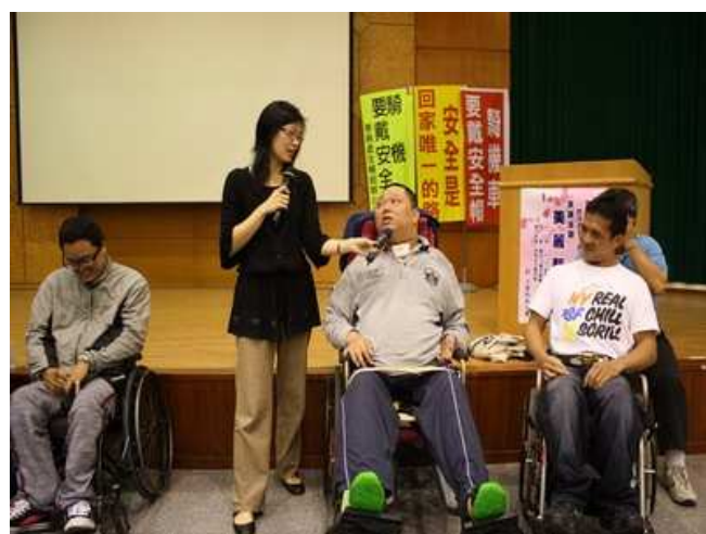
成功之家成員輪流上場分享經驗