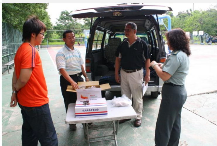
活動前場地勘查及烤肉用品確認