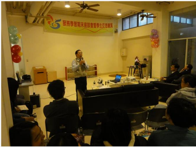
林學務長回覆各導師問題