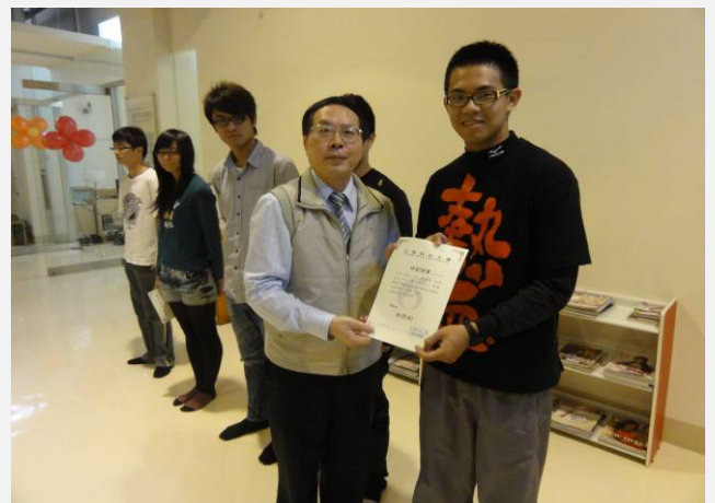
林學務長頒發獎狀