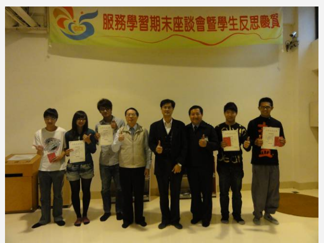
林學務長、郭教務長、楊總教官與同學合照