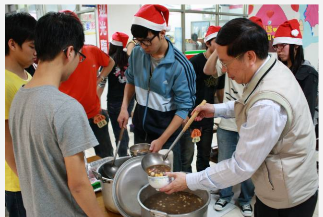
林學務長為宿舍同學盛湯圓