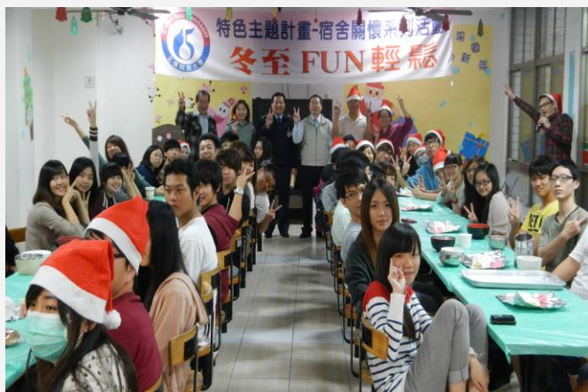
冬至 FUN 輕鬆活動之情形