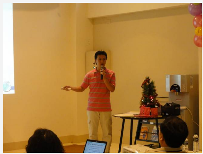
承辦人報告服務學習期末注意事項