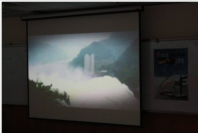
電影「加減2度C」電影播放