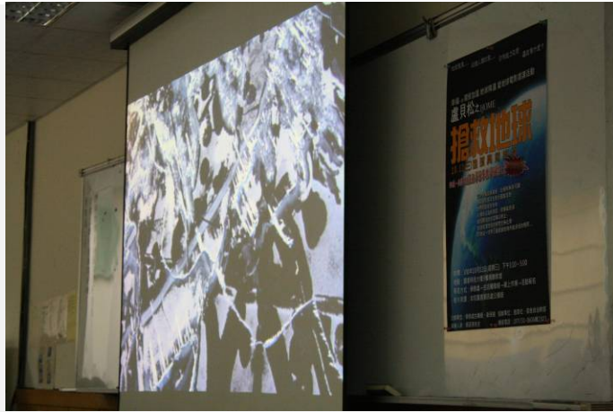
電影「盧貝松之搶救地球」電影播放