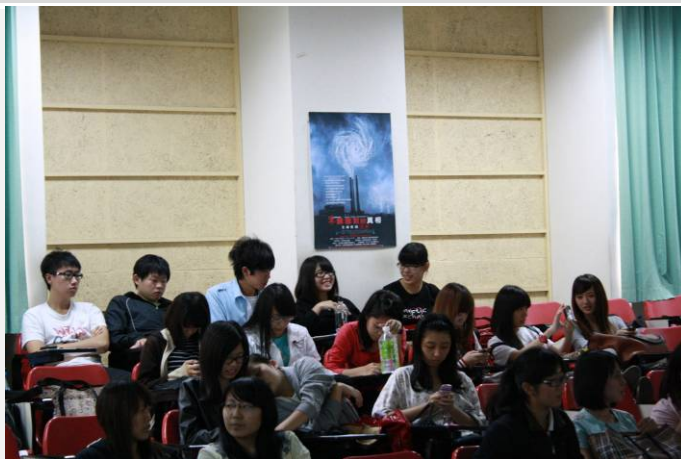
電影「不願面對的真相」同學 錄下心得