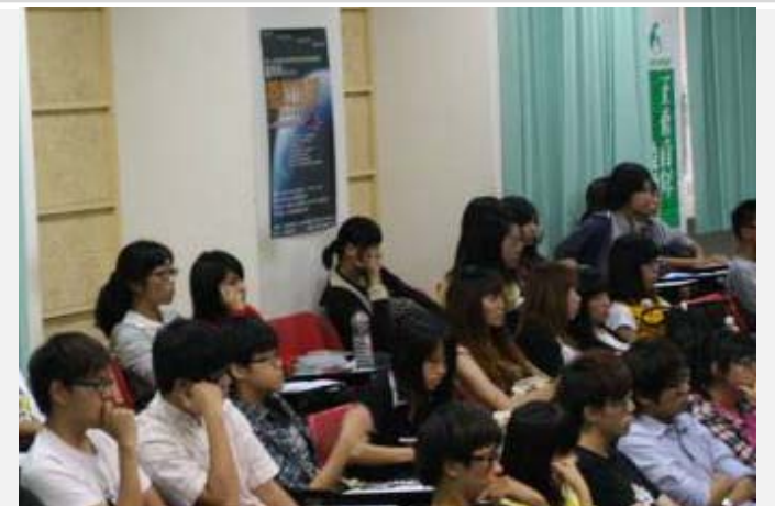
電影「盧貝松之搶救地球」同學認真觀