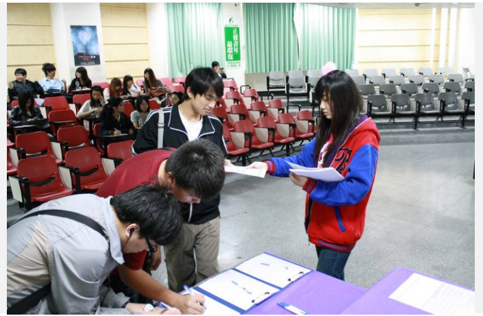
學生入 到( )