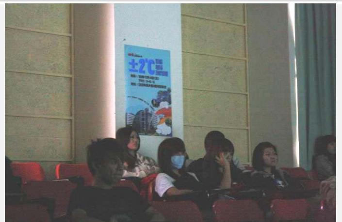
電影「加減2度C」同學認真觀