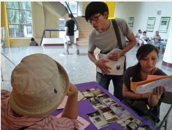
家長帶著新生了解租屋資訊