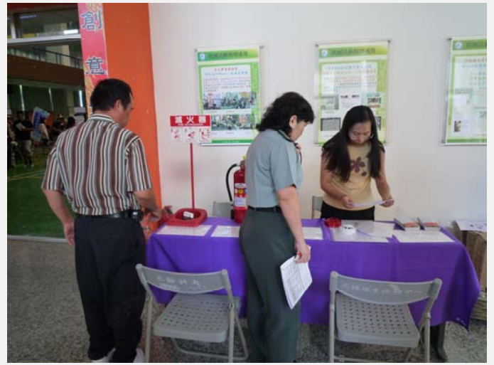
消防設備廠商提供滅火器以及偵煙器給予房東選購