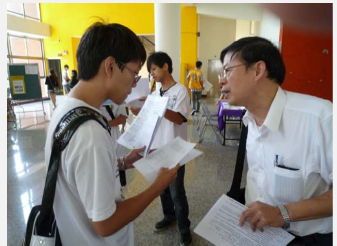
房東貼心的詢問需求與耐心的回答學生問題