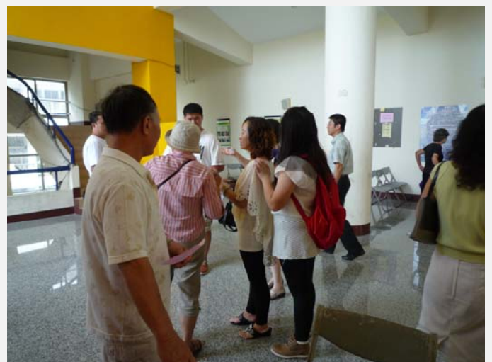
熱情的房東與家長相約直接至現場看房間狀況