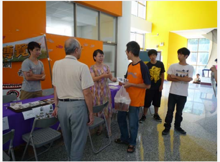
房東熱情與學生家長互動