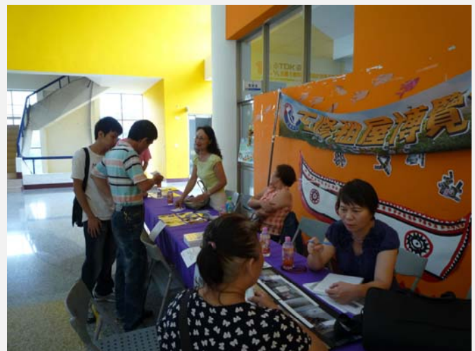
學生家長詢問租屋資訊