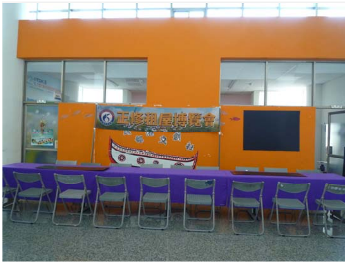
精心佈置租屋博覽會會場