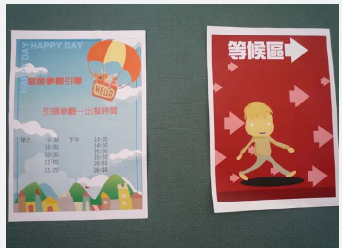
設置等候區提供家長和學生使用