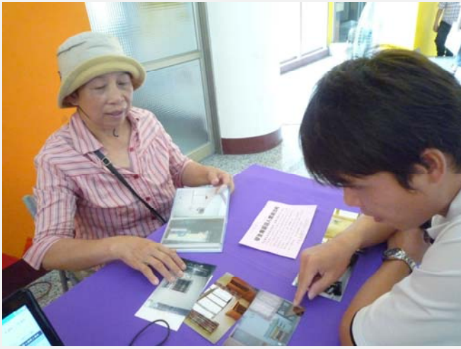
親切的房東親自為學生解說並自備房間照片