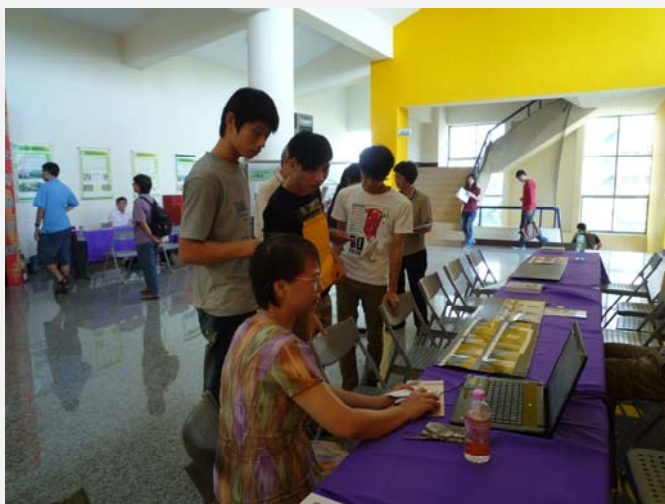
房東也自備筆記型電腦提供學生更清楚的租屋資訊