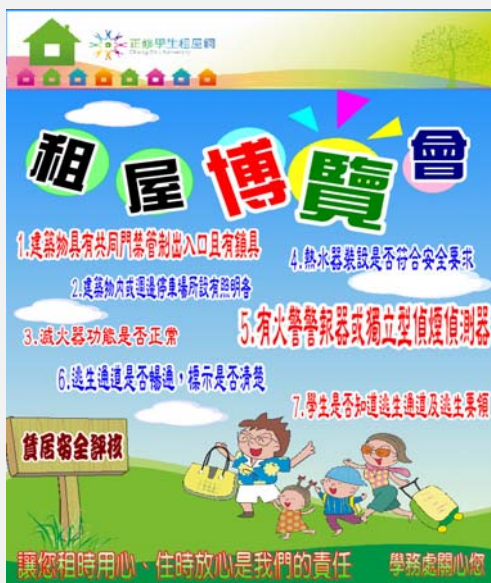
宣導安全租屋-教育部評核 6+1