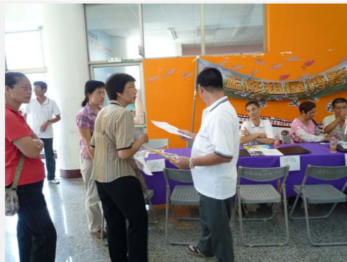
房東自製宣傳單張提供家長更清楚的租屋資訊