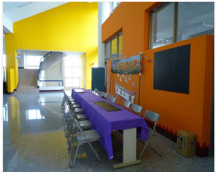
提供礦泉水以及房東可以貼照片的背板