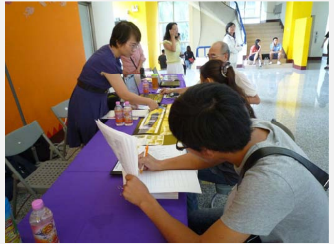
參觀學生留下資料提供校方做後續的追蹤服務