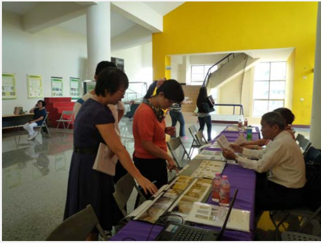
介紹房間與環境設施、交通、租金