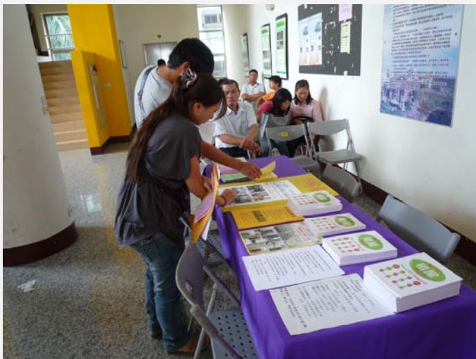
備有租屋手冊提供參考