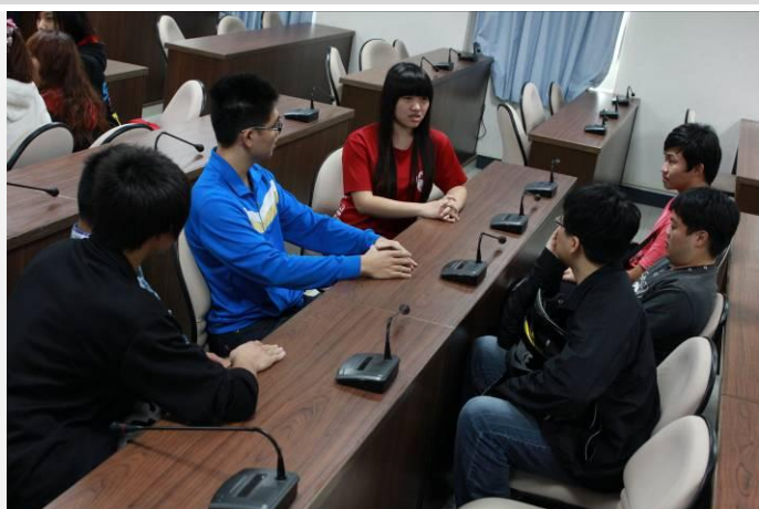
自治幹部分組討論(一)