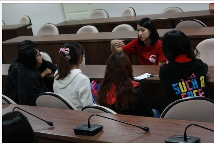
自治幹部分組討論(二)