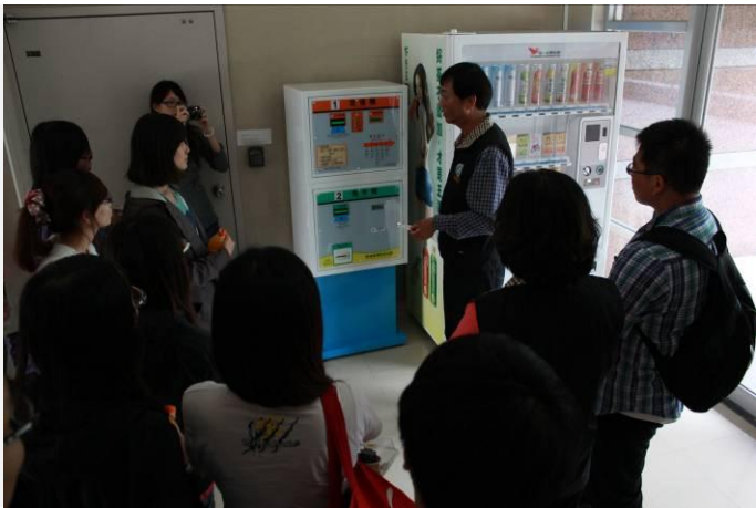
高應大燕巢校區宿舍實地參訪