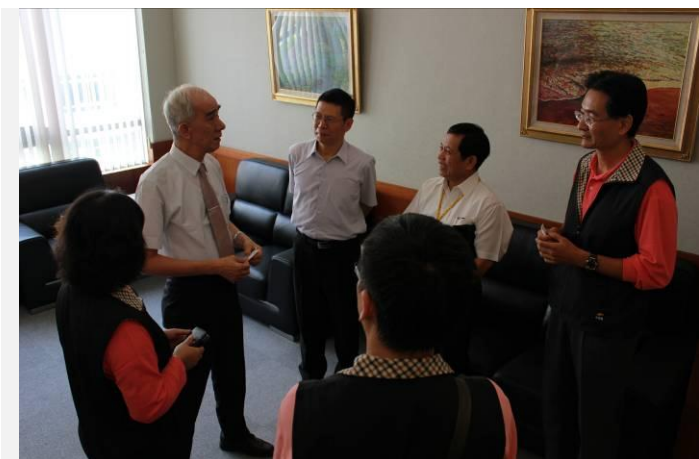
受到樹人醫專校長熱情款待