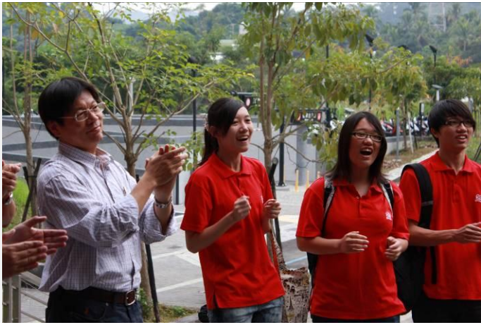
高應大學務長帶領宿舍幹部於門口歡應正修科大參訪