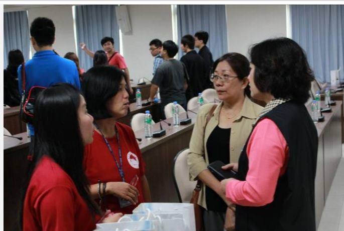
宿舍輔導老師討論