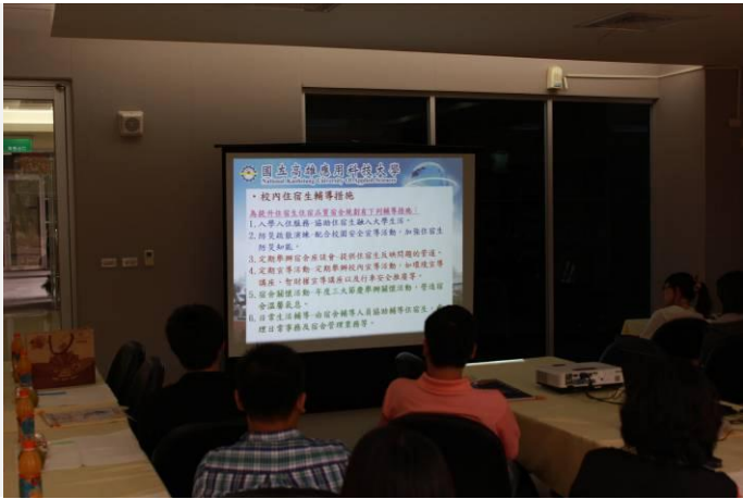
宿舍輔導老師業務簡報