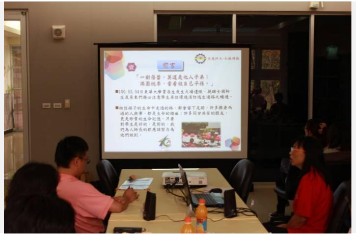
賃居承辦人業務簡報