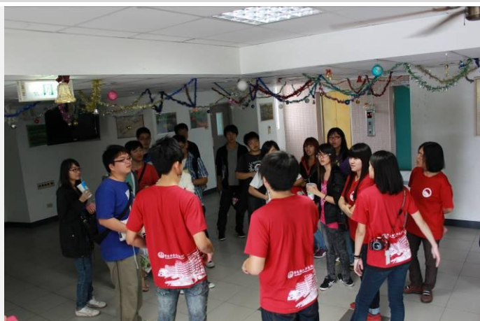
樹人醫專宿舍實地參訪