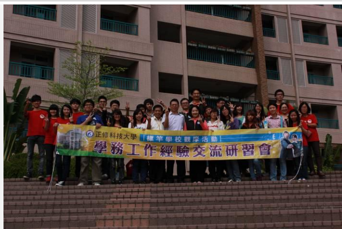
樹人醫專參訪大合照