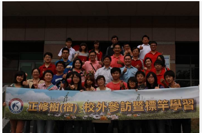
高應大燕巢校區參訪大合照