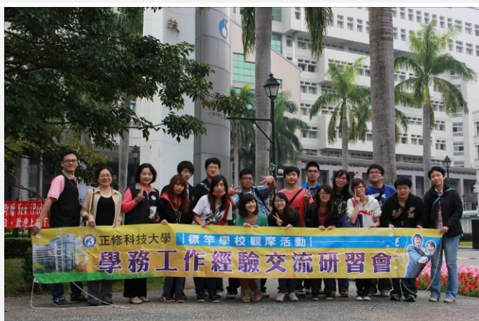
出發前先拍大合照