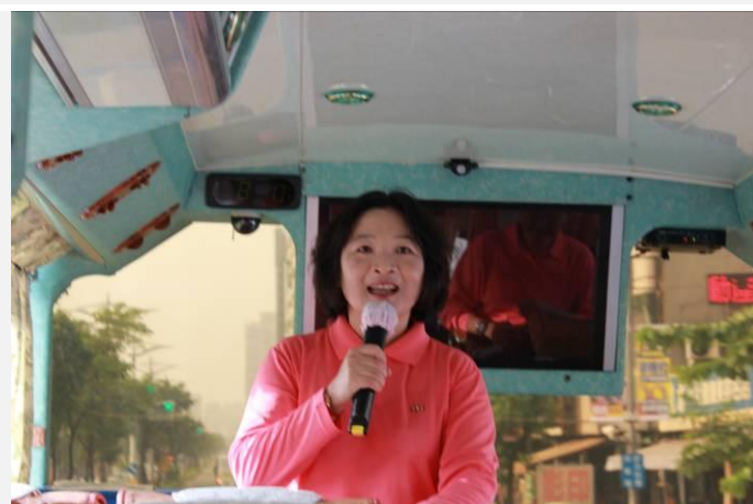
上車生輔組長介紹今天的行程