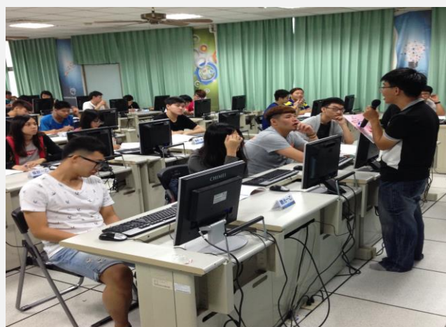
向各班服務說明服務學習之知識(二)