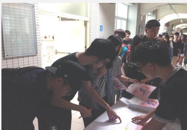
各班服務簽到之情形(一)

而今年 104 學年的大一新生需修習勞作教育課程，藉勞作教育瞭解愛惜環境，學習手腦並用與身體力行，體驗服務學習理念，孕育勞作教育的基礎精神，培養正確的價值觀念，日後為產業界奉獻服務。