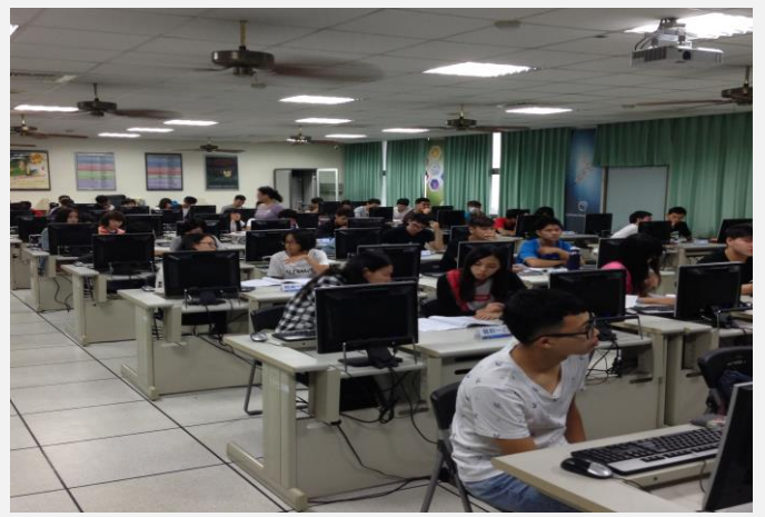
活動執行之現場實況紀錄(二)