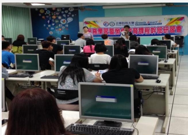
向各班服務說明服務學習之知識(一)