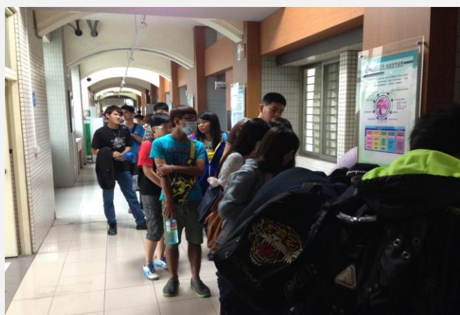
各班服務簽到之情形(二)