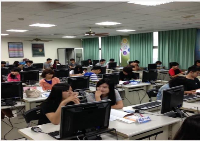
活動執行之現場實況紀錄(一)