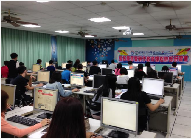
服務學習系統線上操作