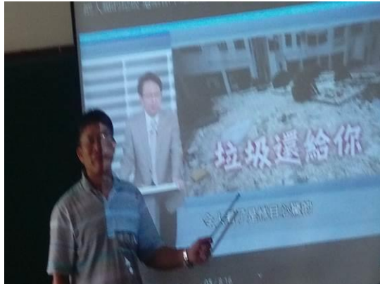
活動說明： 108.6.05 海洋垃圾探討