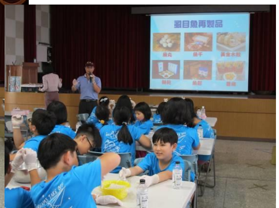
活動說明： 107.11.08 虱目魚的由來 +認識虱目魚