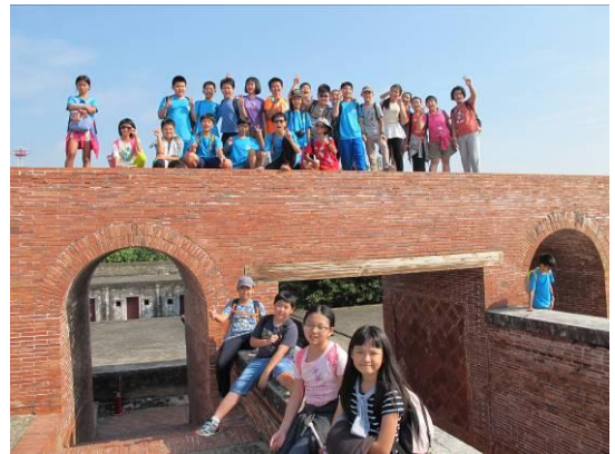
活動說明： 107.12.06 欣賞旗后砲臺風光 + 認識旗后歷史