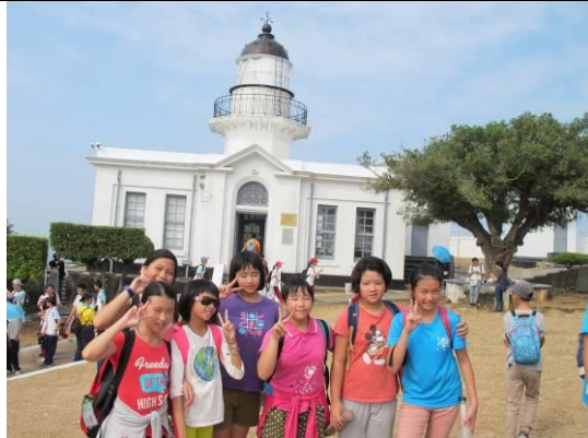
活動說明： 107.12.06 欣賞旗津燈塔風光 + 認識旗后歷史