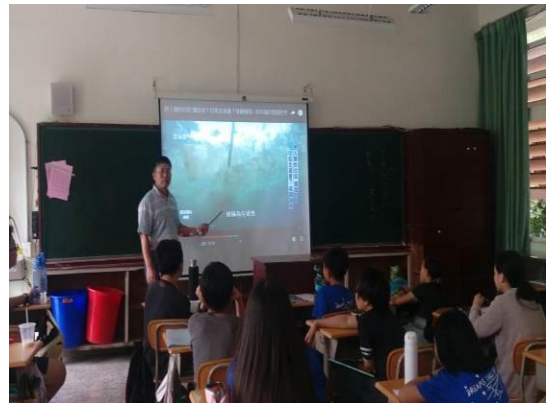
活動說明： 108.6.5 海洋垃圾探討