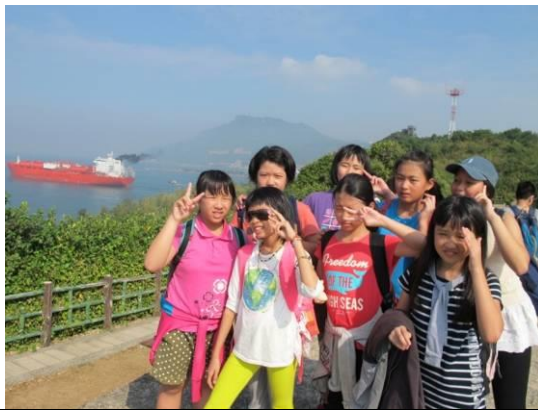
活動說明： 107.12.06 眺望臺灣海峽