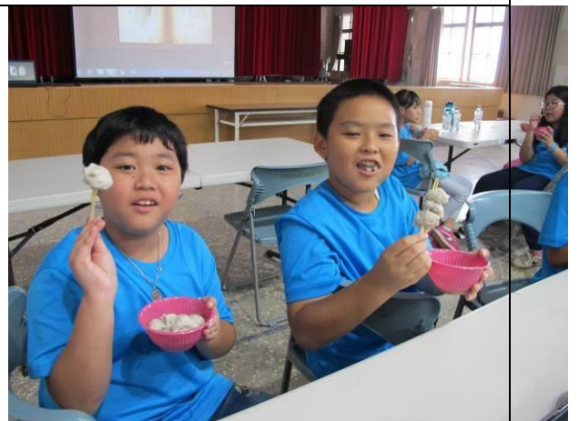
活動說明： 107.11.08 享用自製的虱目魚丸