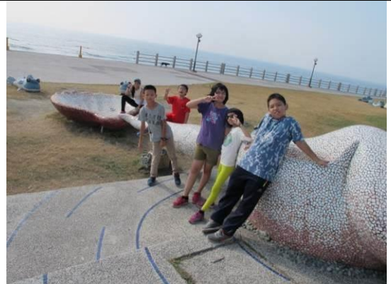
活動說明： 107.12.06 欣賞風車公園藝術品 + 親近海洋