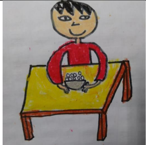
活動說明：學生將活動過程寫在圖文日記中