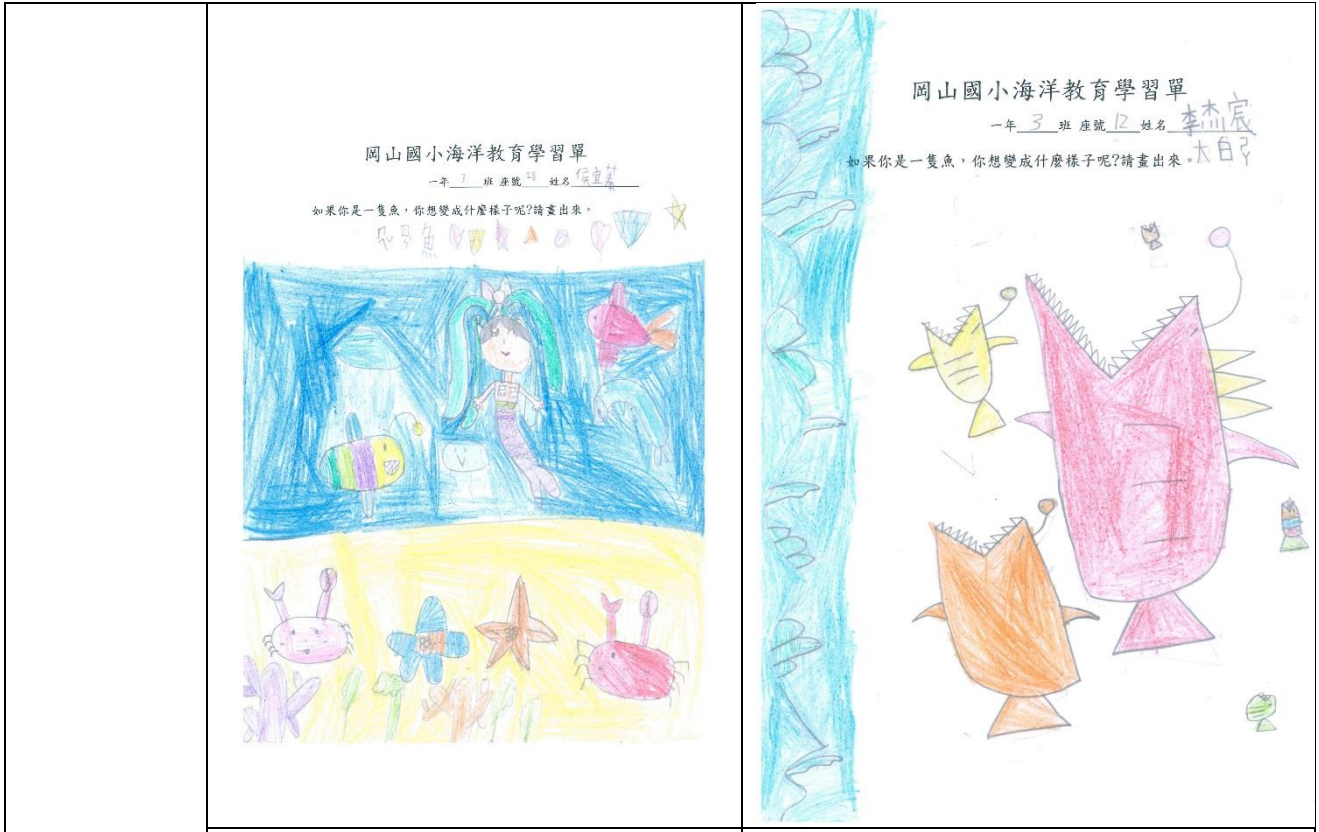
活動說明:學生學習單