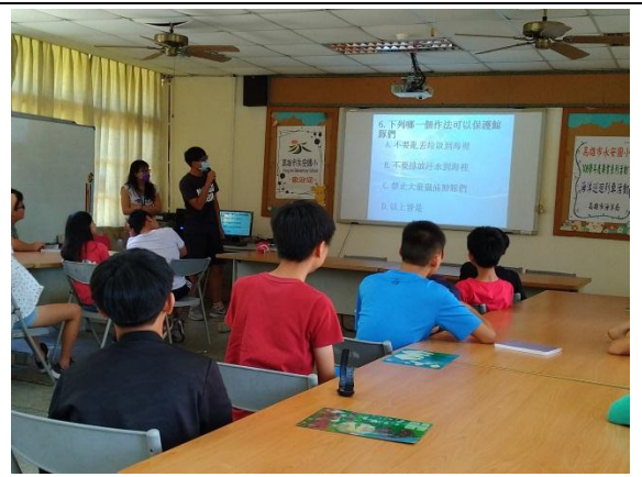
活動說明：研討保護鯨豚作法