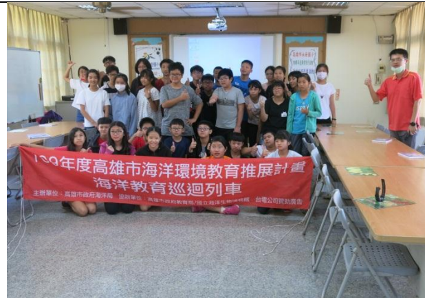
活動說明：海洋巡迴列車活動合影