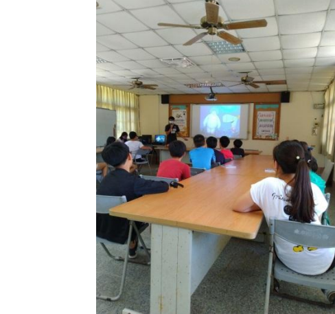
活動說明：結合海洋局外聘講師到校進行保護海洋專題講座