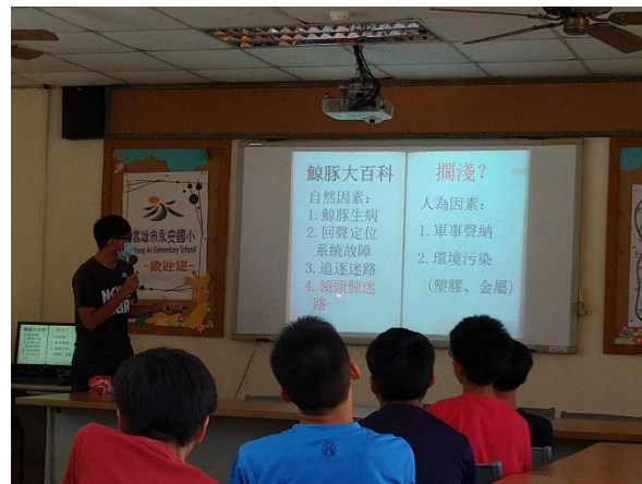
活動說明：講師說明海洋生物所面臨的危機