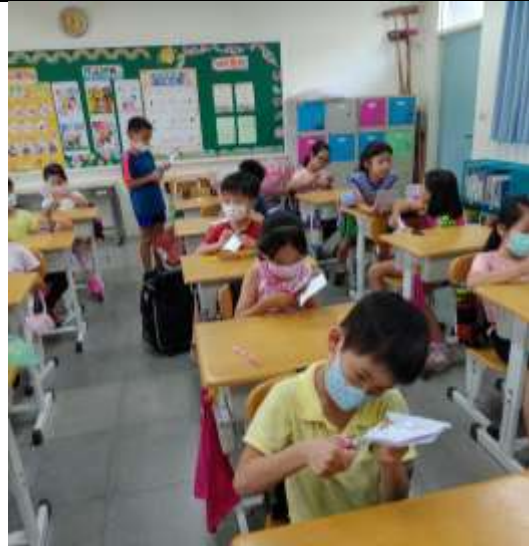
活動說明：製作立體卡