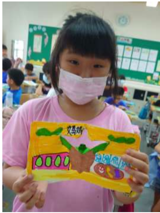
活動說明：完成立體卡