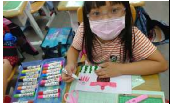
活動說明：彩繪立體卡