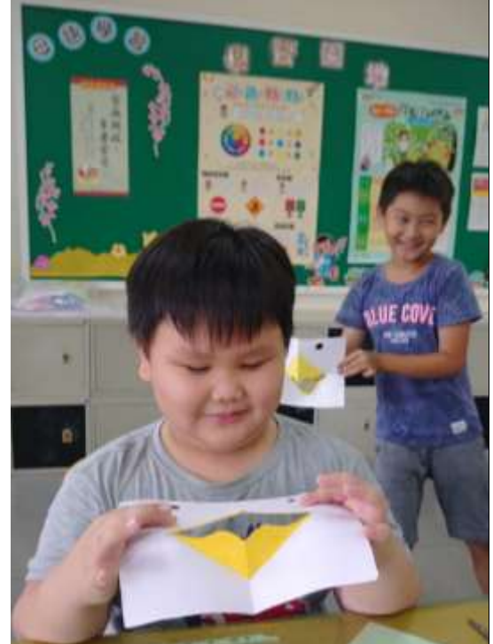
活動說明：完成立體卡