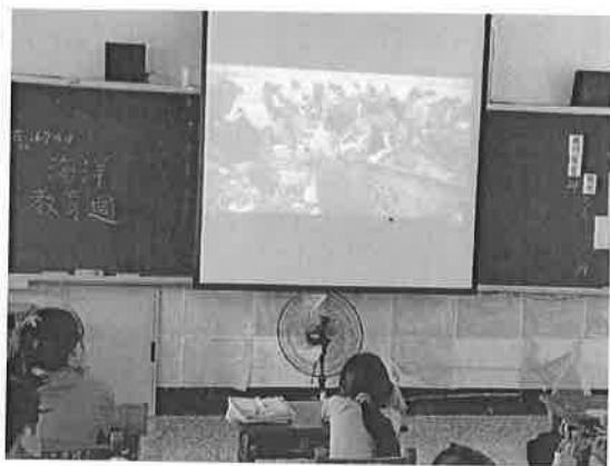
活動說明：淨灘活動