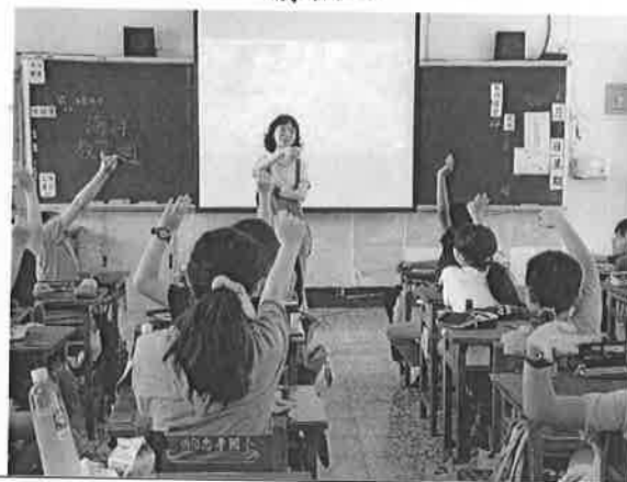
活動說明：舉例說明日常生活中無塑例子