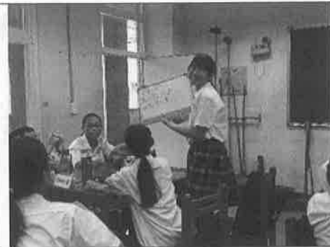
活動說明：新課綱彈性課程-認識世界的方法。活動：我對海洋的印象。