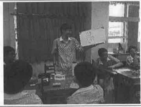
活動說明：新課綱彈性課程-認識世界的方法。活動：如何形容海洋。