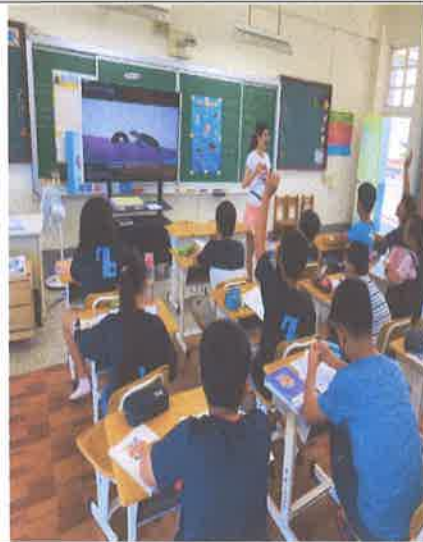
活動說明：觀看完海龜的求生之旅教育影片，針對影片內容做有獎徵答活動。