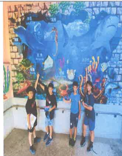
活動說明：帶學生認識海洋主題的環境布置。學生手指自己最喜愛的海洋生物。