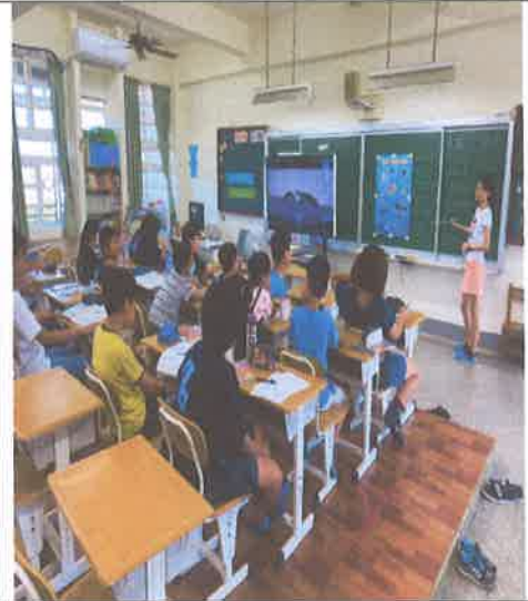
活動說明：逐一介紹海報上的海洋生物特色和其英語單字。